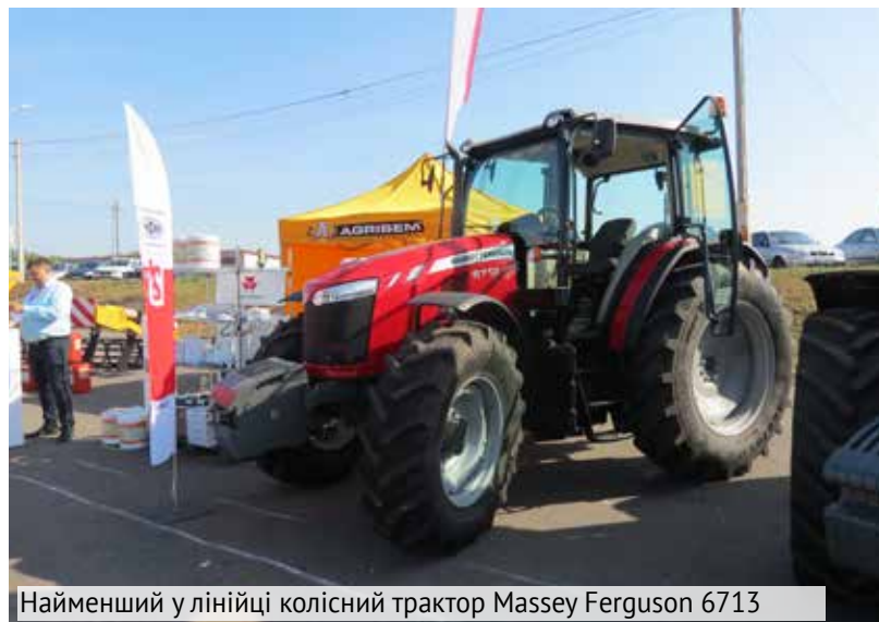
Найменший у лінійці колісний трактор Massey Ferguson 6713