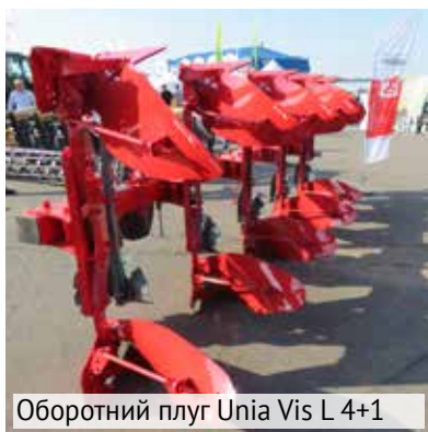
Оборотний плуг Unia Vis L 4+1