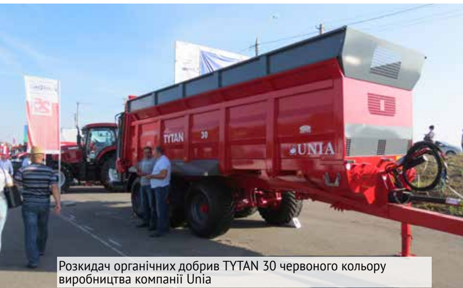
Розкидач органічних добрив TITAN 30 червоного кольору виробництва компанії Unia

Massey Ferguson 7722, оснащений двигуном другого покоління об'ємом 7,4 л з електронним управлінням потужністю 220 к. с., даремно потрапив