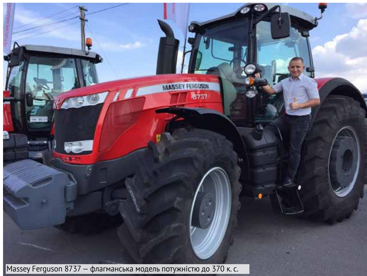
Massey Ferguson 8737 – флагманська модель потужністю до 370 к. с.

Найменший у лінійці колісний трактор Massey Ferguson 6713 із механічною трансмісією отримав чи не найбільше уваги відвідувачів виставки. Його надійний і економічний 4-циліндровий двигун AGCO Power з об'ємом 4,4 л розвиває потужність 132 к. с. (98кВт). Він скон-